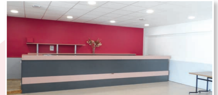
Création d'un sanitaire accessible aux personnes à mobilité réduite dans le hall de la salle des fêtes ; réfection du plafond et des peintures