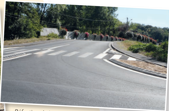
Réfection de la chaussée aux entrées et sorties de bourg et sur le pont de Saint-Branchs. Aménagements financés par la commune ; voirie réalisée par le département.