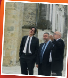
Visite de la commune par M. Charnassé, architecte des Bâtiments de France