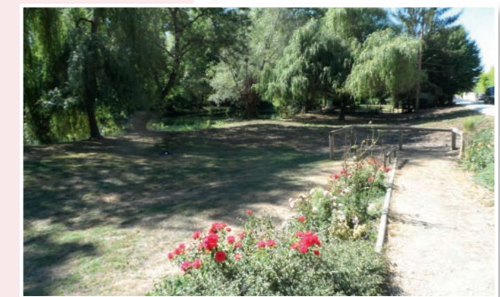
Acquisition, débroussaillage et ouverture au public