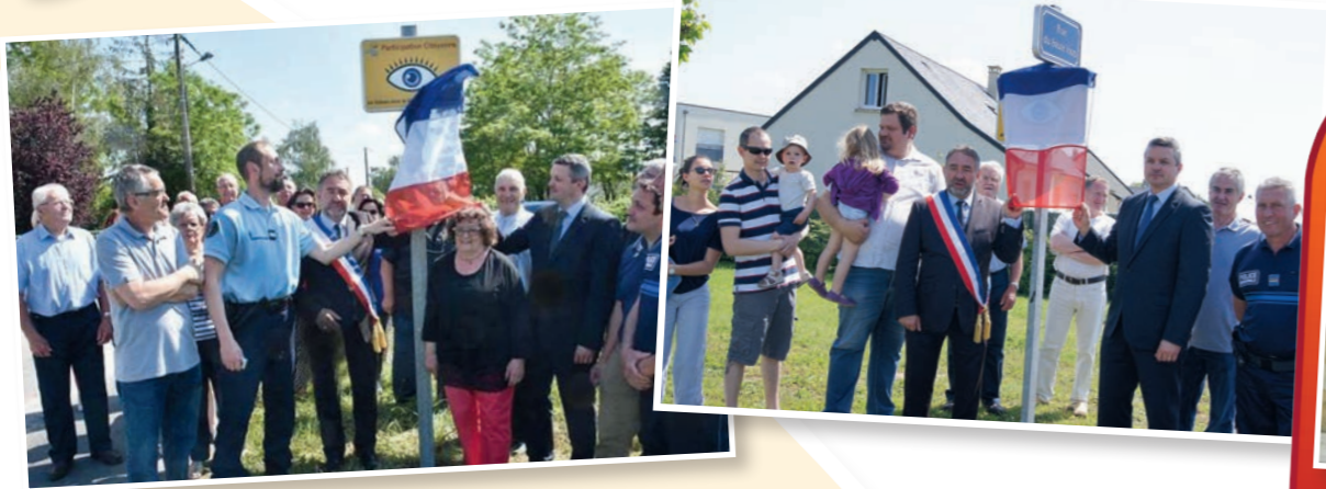
Inauguration du dispositif Participation Citoyenne aux Reçais et aux Jardins du Vallon 2