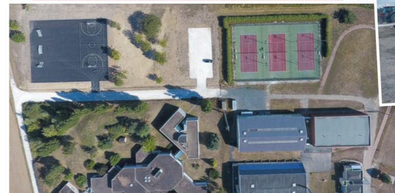
Création d'un skate park, d'un city park, élargissement de la voirie et création d'un parking