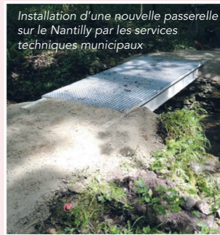
Installation d'une nouvelle passerelle sur le Nantilly par les services techniques municipaux