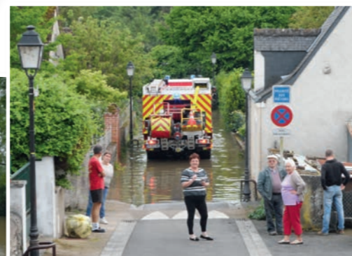
La crue de l'Indre et de l'Échandon a permis de tester en conditions réelles le plan communal de sauvegarde