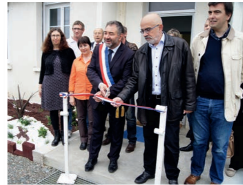
Inauguration du centre technique municipal, un nouvel espace de travail et de stockage de 1.800 m 2